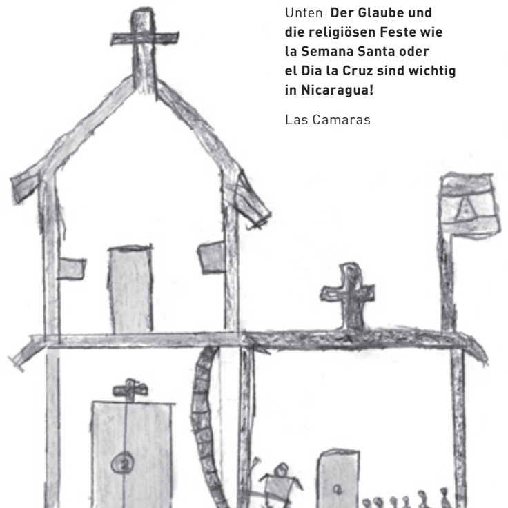
Unten Der Glaube und die religiösen Feste wie la Semana Santa oder el Dia la Cruz sind wichtig in Nicaragua!