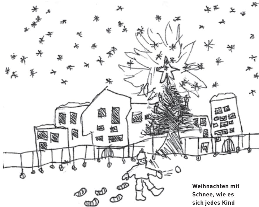
Weihnachten mit Schnee, wie es sich jedes Kind wünscht.

Alle Menschen, ob gross oder klein, verkleiden sich an der Fasnacht.