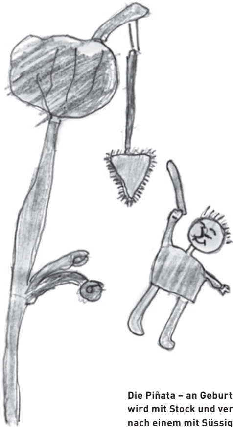
Die Piñata – an Geburtstagsfesten wird mit Stock und verbundenen Augen nach einem mit Süßigkeiten gefüllten Tongefäss geschlagen.